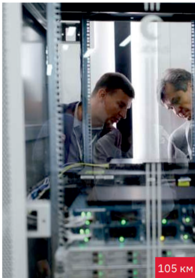
Системный интегратор РТК-Сервис 105 км / 2020 г.

ДПЛ-П-24У (3x8)-3,5кН Поставка ВОК для нужд организации