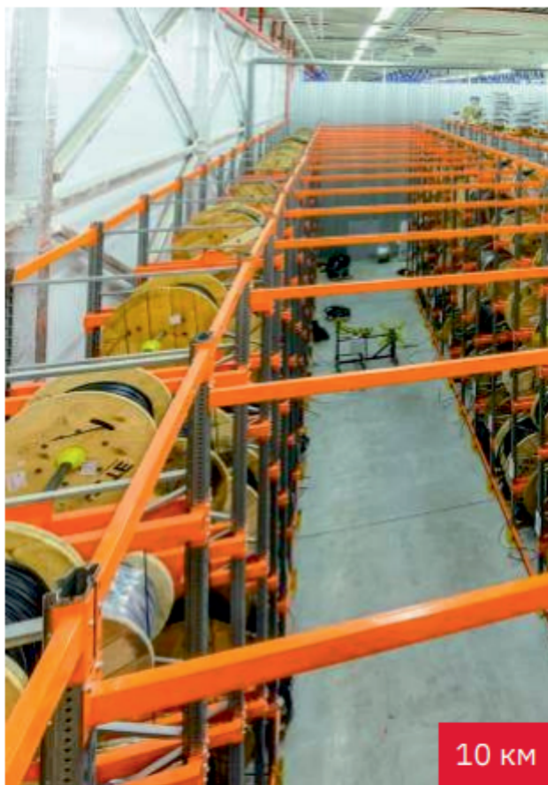
Завод ПожТехКабель Поставка 10 км / 2020 г.

ДПЛ-П-24У (3x8)-3,5кН Поставка ВОК для нужд организации