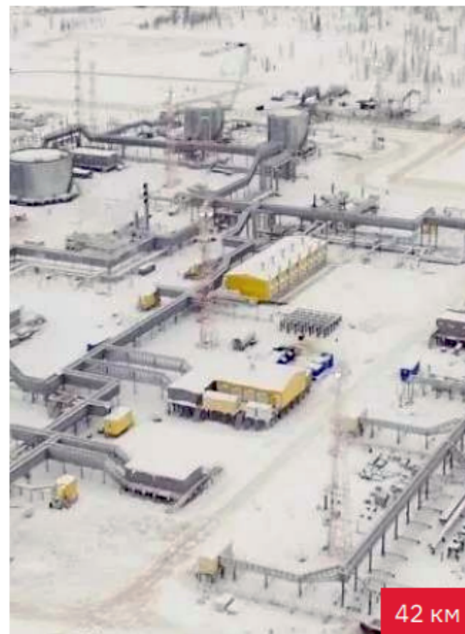
ПСП Заполярное Система связи 42 км / 2020 г.

Официальный дилер завода Инкаб, ССД с 2009 г.